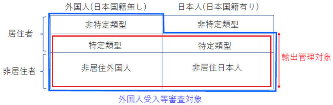
図 1 外国人受入等審査および輸出管理の対象